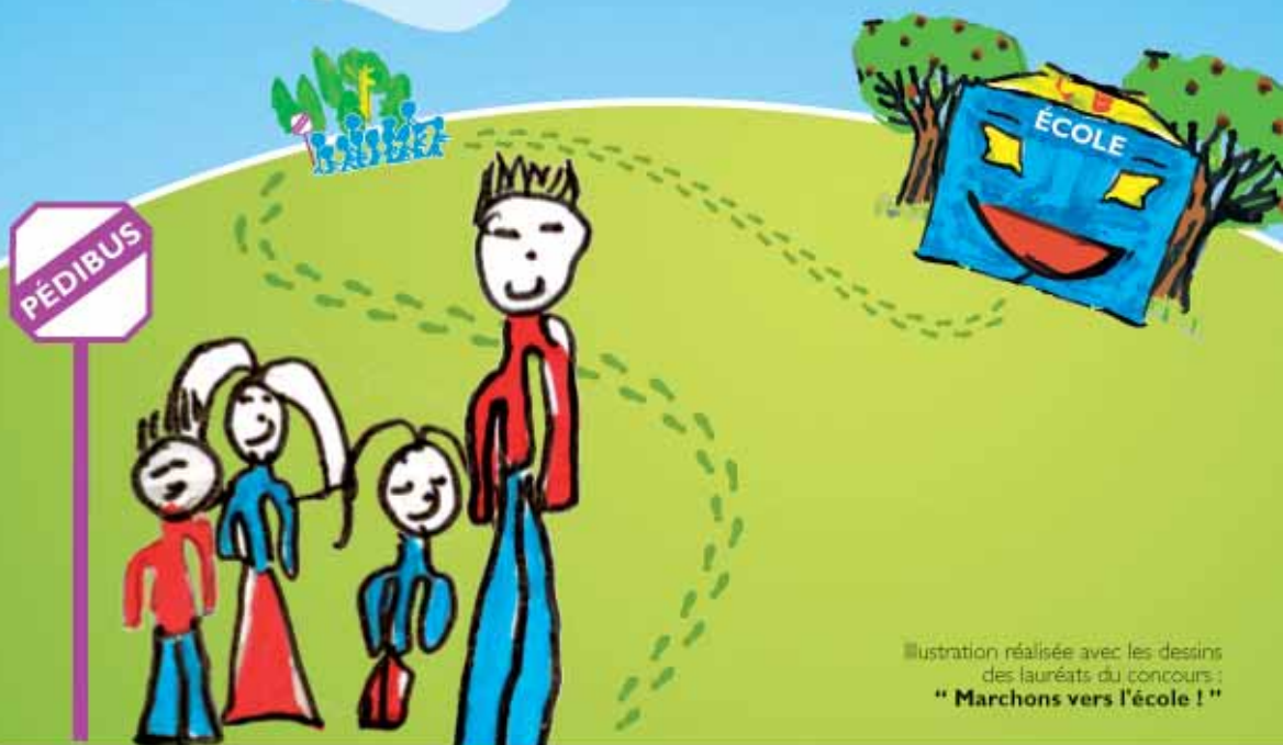
Illustration réalisée avec les dessins des lauréats du concours : " Marchons vers l'école ! "

des pas vers l'école... un bond pour la planète !